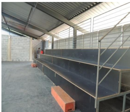
Figura 4: Galpão e espaço de apresentações