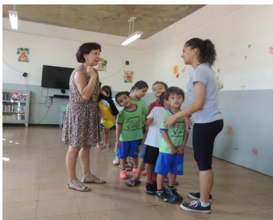
Figura 37: Interação entre professora e arte-educadora

Há, ainda, a professora que observa todas as aulas e participa de algumas com os alunos e a arte-educadora por acreditar que os alunos participam melhor das aulas quando a professora participa junto com a arte-educadora. Afirma que, quando o professor participa das aulas de arte-educação, tem a oportunidade de trabalhar sua corporeidade, de experimentar e expressar os próprios sentimentos e sensações, e que todos os professores devem participar das aulas para poder se soltar mais. A corporeidade das professoras, arte-educadoras e alunos é afetada pelas relações de compartilhamento ou pela ausência destas. A Figura 37 mostra um momento de interação entre professora e arte-educadora.