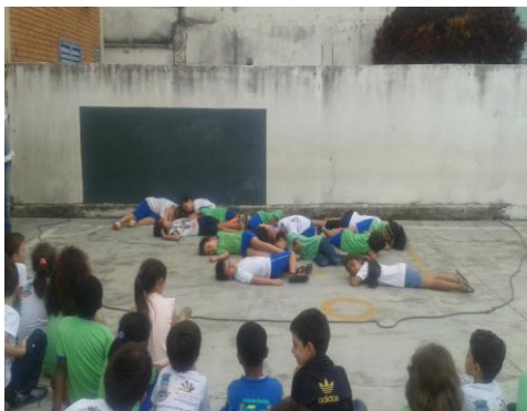
Figura 23: Apresentação no pátio – EMER