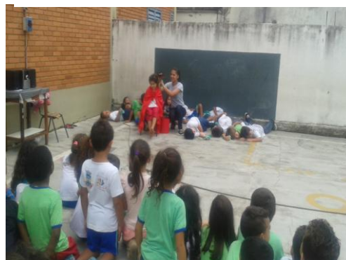
Figura 24: Apresentação no pátio pelas crianças – EMER