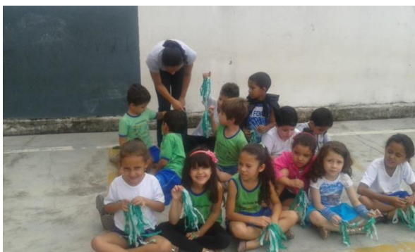
Figura 49: Apresentação teatral