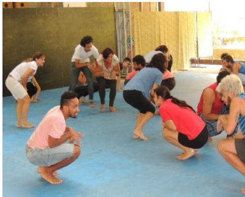
Figura 12: Atividade lúdica com movimentos de animais