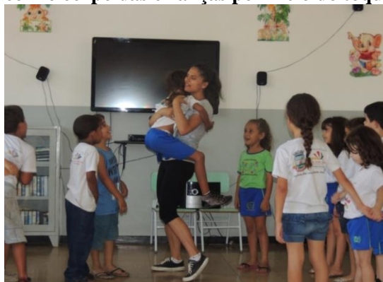
Figura 33: O corpo da arte-educadora interagindo com o corpo das crianças por meio do toque