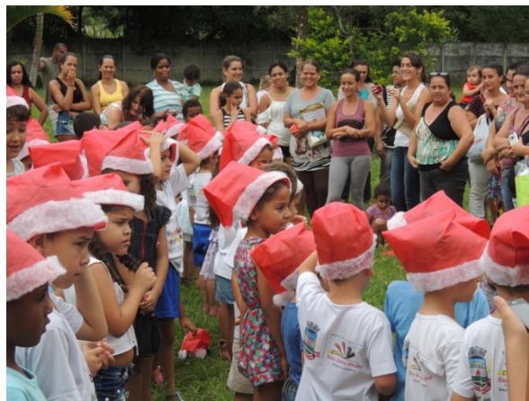
Figura 22: Apresentação de Natal

A Figura 22 ilustra uma apresentação de final de ano na EMMJ com a temática do Natal, uma prática muito comum nas escolas de Educação Infantil.