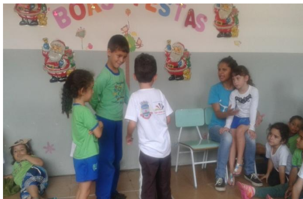
Figura 43: Criança no colo na professora, “dificultando” suas ações

todo sentada com ela, mas ela tem que sentir que ela faz parte do grupo, porque o grupo é dela.