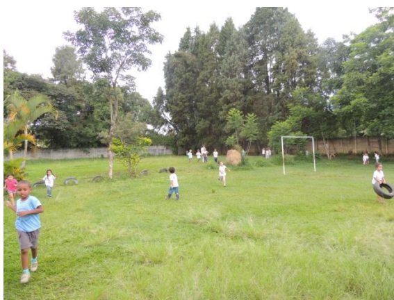
Figura 44: Espaço externo da escola EMMJ

Percebi uma questão contraditória no trabalho das arte-educadoras. Embora a pesquisa aponte que elas primam pela liberdade dos corpos das crianças, todas as atividades foram realizadas dentro de uma sala, apesar de em ambas as escolas haver um bom espaço externo para a realização delas conforme a Figura 44.