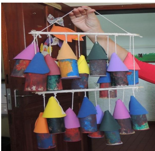
Figura 48: Casinhas de gnomos