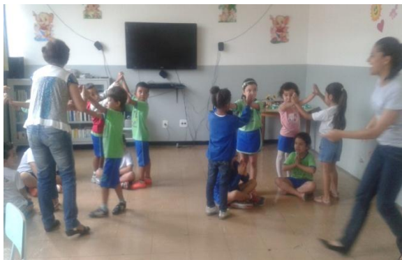
Figura 38: Participação da professora em uma das aulas do APTP