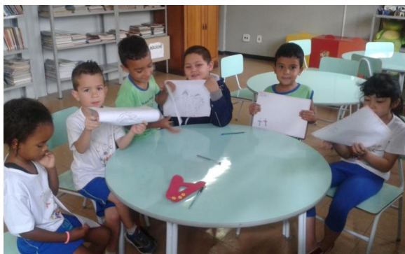
Figura 27: Atividade de desenhos das crianças da EMER

O desenho também é uma prática artística muito presente no contexto escolar. Algumas propostas de produção de arte do APTP se deram por meio dessa atividade. Em vários desenhos, foi possível identificar a roda e a professora como elementos evidenciados, apontado significados construídos pela criança. As Figuras 27, 28, 29 e 30 são das crianças desenhando. Percebe-se que há uma recorrência de desenhos de roda e outros que evidenciam a arte-educadora.