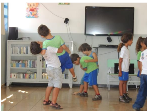
Figura 31: Brincando com os corpos – EMER