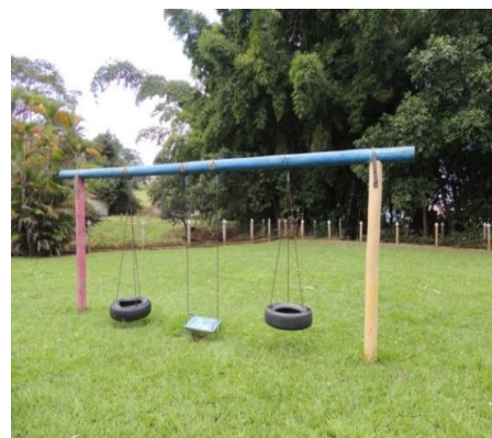
Figura 3: Parque