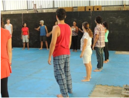
Figura 8: Atividade lúdica com bolas coloridas