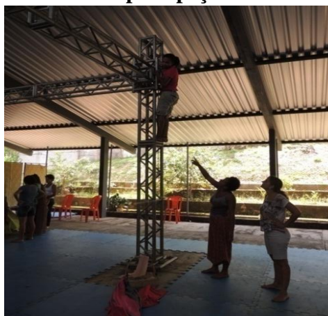
Figura 14: Construção de cenário para peça teatral