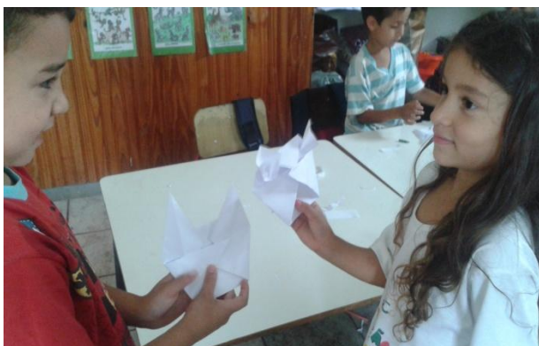
Figura 46: Crianças trocando ideias sobre suas produções