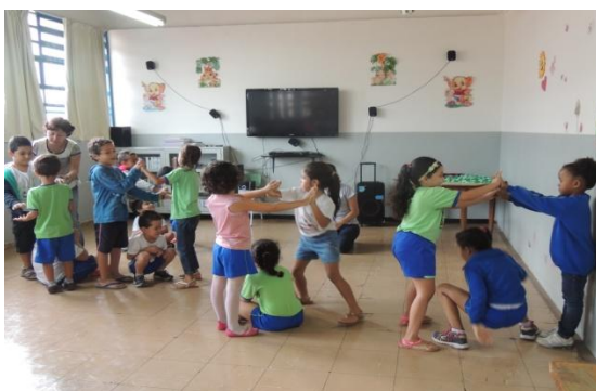
Figura 41: Brincadeira com o tema “casas”