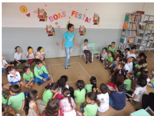
Figura 25: Apresentação teatral na sala da EMER