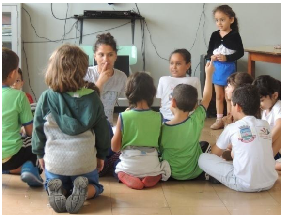
Figura 36: Comunicação não verbal

Não são apenas os olhos que veem. Vemos de corpo inteiro, assim como não é apenas a boca que sorri, mas todo um corpo que se movimenta. Percebi que as arte-educadoras são aparentemente mais calmas que as professoras. Têm um sorriso leve, descontraído. Destaco o sorriso como um ponto de acolhimento para a reflexão. O sorriso verdadeiro é aceitação. E a criança capta essa verdade; percebe o sentido. Quando sorrimos com sinceridade é sinal de que, de alguma maneira, estamos “de acordo” na circunstância. As professoras sorriem, e falam, e sorri, e falam novamente. Numa necessidade ansiosa de comunicação, precisam ser ouvidas. Exercem bem mais a fala que a escuta. As arte-educadoras sorriem e escutam, escutam e sorriem depois que falam. Esse corpo da escuta estabelece outras formas de comunicação corporal, que não apenas da palavra dita como nos mostra a Figura 36.