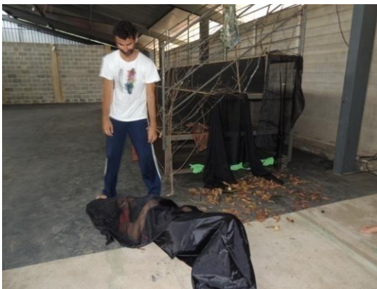
Figura 16: Apresentação da história “As lagartas negras”