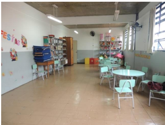
Figura 45: Sala de atividades do APTP na EMER

Na escola EMER, as aulas aconteceram na sala de vídeo/biblioteca, onde era preciso afastar os móveis e mudar a disposição dos brinquedos; e na EMMJ, aconteceram na própria sala de aula, conforme Figura 45.