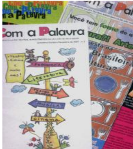
Figura 21: Exemplos da revista “Com a Palavra”