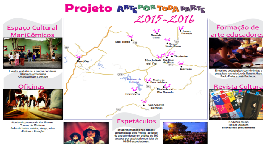
Figura 6: Mapa do Campo das Vertentes onde atua o APTP

Atualmente, desenvolve cinco ações fundamentais: Oficinas de teatro, artes plásticas, dança, literatura e música para crianças, jovens e adultos; Apresentações de espetáculos teatrais nas comunidades que recebem o Projeto; Formação livre e continuada de arte educadores; Distribuição gratuita da Revista Cultural “Com a Palavra”, contendo informações culturais das localidades atendidas; e Manutenção do Espaço Cultural Teatro da Pedra, conforme podem ser visualizadas na Figura 6.