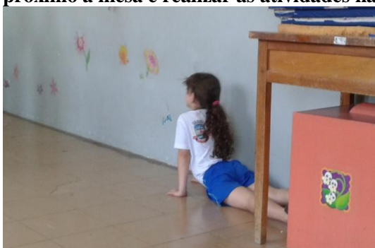
Figura 39: Criança decidiu ficar no canto próximo à mesa e realizar as atividades naquele local