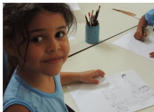
Figura 30: Desenho da criança da EMMJ

Nota: destaque para a roda e a presença da professora