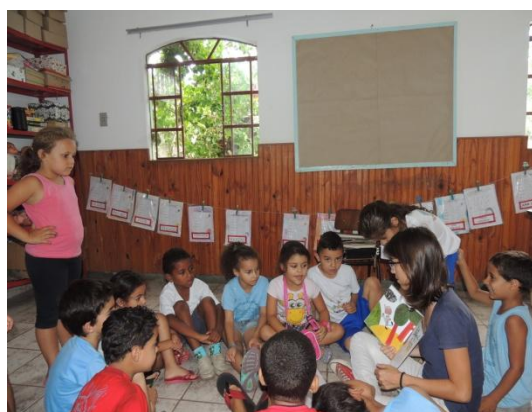
Figura 34: Roda na EMMJ