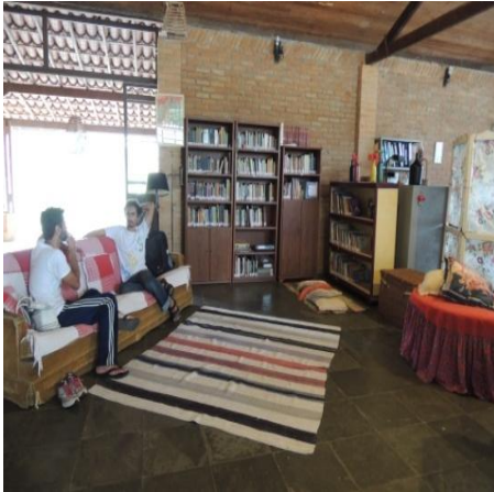
Figura 18: Sala de reunião/biblioteca do APTP