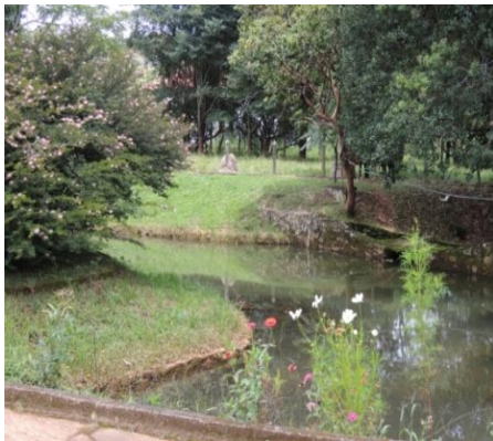
Figura 2: Área de lazer