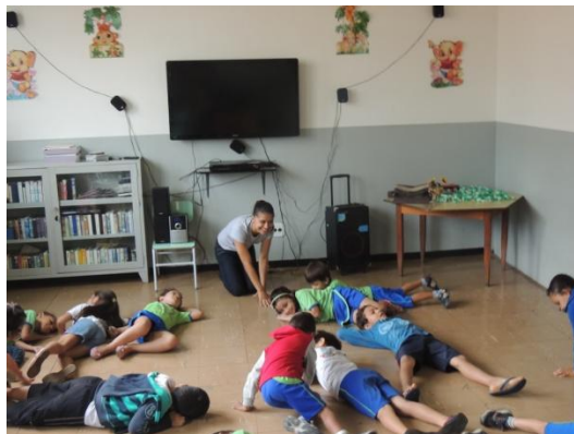
Figura 42: Início de uma atividade de relaxamento